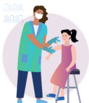
Szczepienia nastolatków przeciw HPV

W celu ochrony kobiet przed niszczącymi skutkami raka szyjki macicy WHO apeluje o: