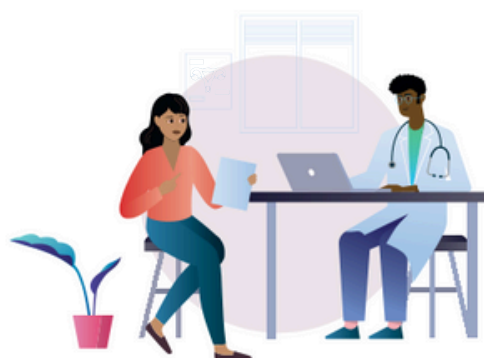
Regularne badania przesiewowe w kierunku HPV oraz odpowiednie leczenie